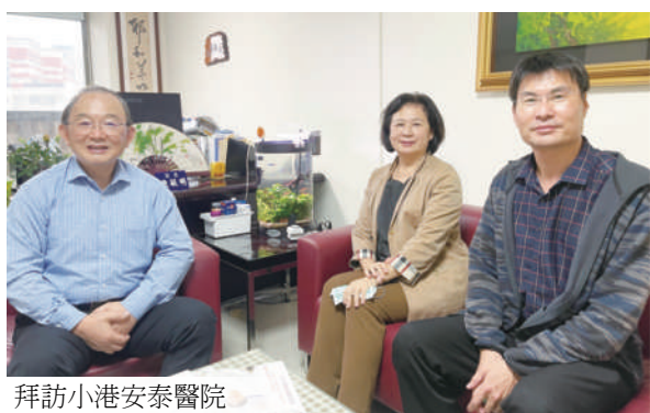
拜訪小港安泰醫院