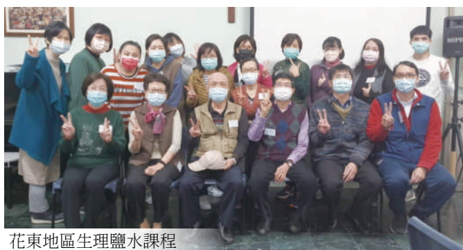
花東地區生理鹽水課程