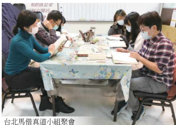
台北馬偕真道小組聚會