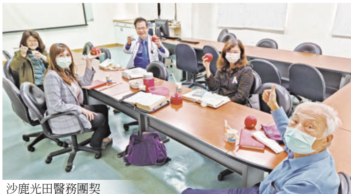
沙鹿光田醫務團契