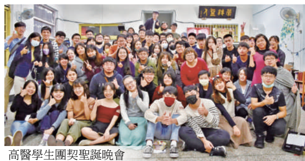
高醫學生團契聖誕晚會