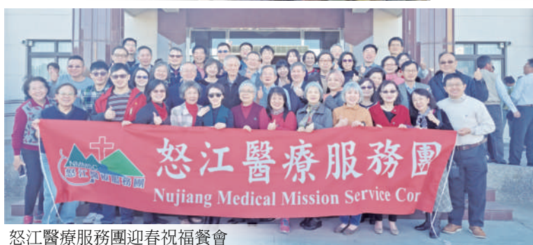
怒江醫療服務團迎春祝福餐會