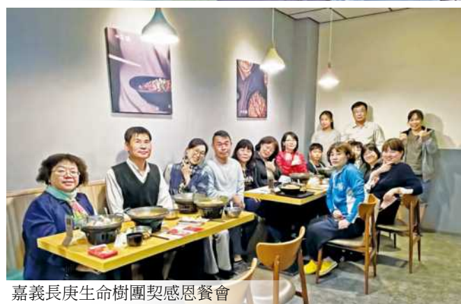
嘉義長庚生命樹團契感恩餐會