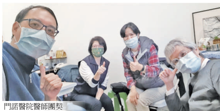
門諾醫院醫師團契