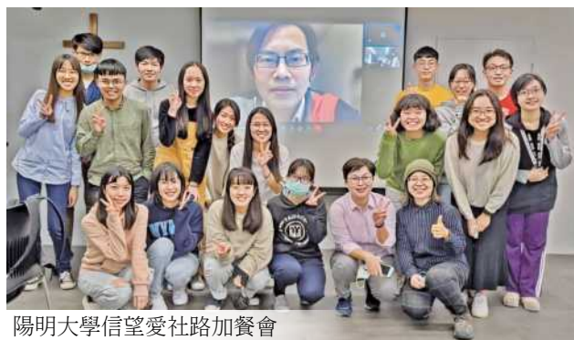
陽明大學信望愛社路加餐會