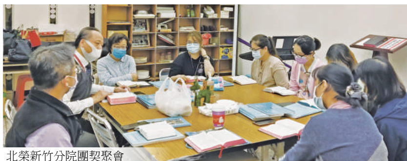
北榮新竹分院團契聚會