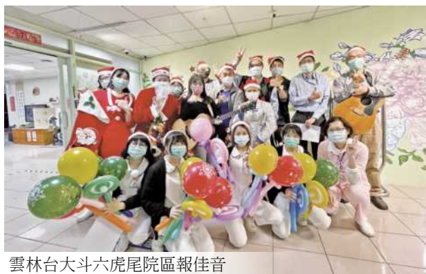
雲林台大斗六虎尾院區報佳音