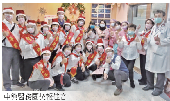
中興醫務團契報佳音