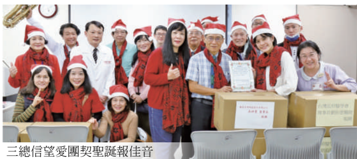
三總信望愛團契聖誕報佳音