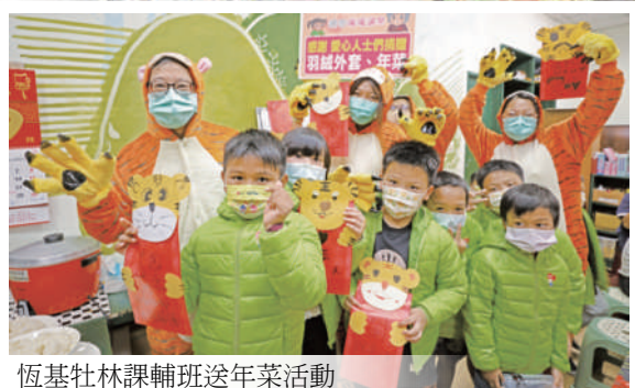
恆基社林課輔班送年菜活動