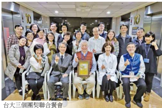
台大三個團契聯合餐會