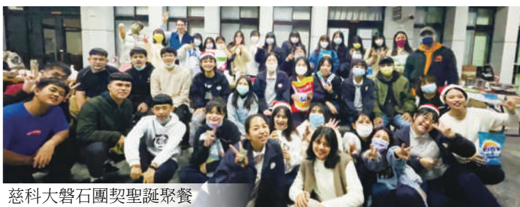
慈科大磐石團契聖誕聚餐