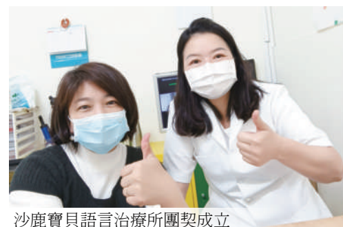
沙鹿寶貝語言治療所團契成立