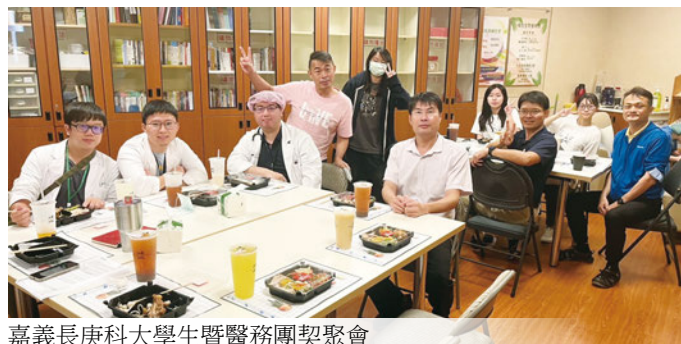
嘉義長庚科大學生暨醫務團契聚會