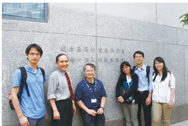
▲ 2012年5月返回母校哈佛大學在Takemi Program (International Health Program)演講後與參加的台灣留學生合影

人對醫院服務品質的信心，並不能代表真正的診療品質。唯有長期持續追蹤病人的狀況，探討這樣的診斷及治療是否有助於改善生活品質及增進平均餘命，才能真正落實病人的健康。因此，我們透過發展「健康計量方法」，計算多活一個健康人年需花費多少錢，以此進行健康科技評估作為預防、診斷、治療、及復健等健康服務效果的依據，提升各疾病診療的價值與效益。例如：「血液透析」與「腹膜透析」兩種洗腎方式的成本效果相較之下，我們的研究發現同樣條件的病人，使用血液透析比腹膜透析每健康人年約貴九萬元，終身花費約多花一百萬元以上，將此數據提供給決策單位作參考。此外，我們也積極推動各種疾病預防與減少環境職業傷病，減少新病人的發生，如此健保就不需要支付醫療花費，有助於政府訂立各種醫藥衛生政策，在最低成本的醫療給付下，人民健康依然能達到最大的期望值，讓健保政策能永續推動。