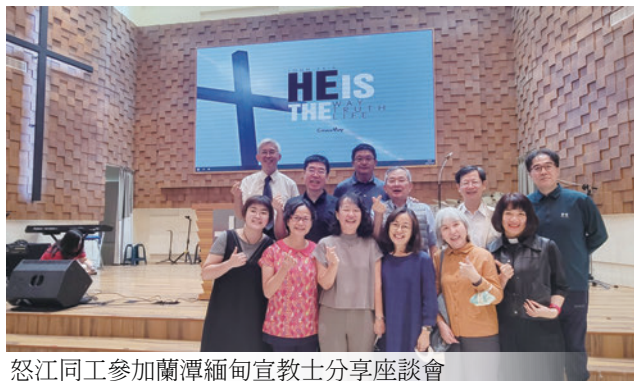
怒江同工參加蘭潭緬甸宣教士分享座談會