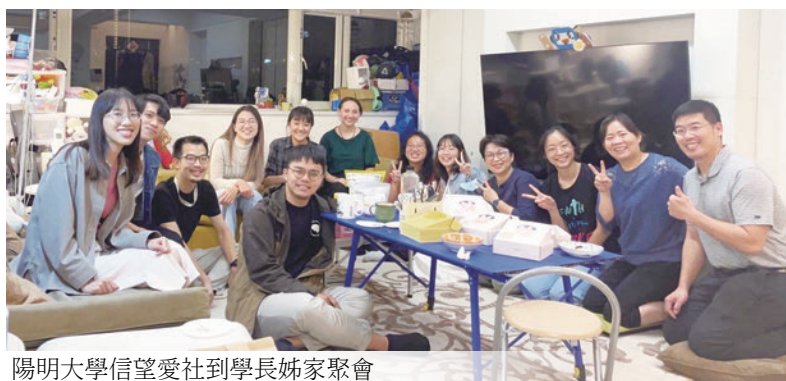
陽明大學信望愛社到學長姊家聚會