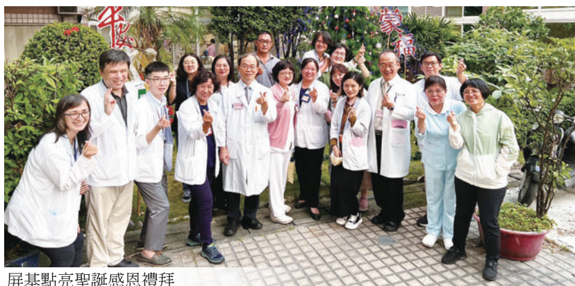
屏基點亮聖誕感恩禮拜