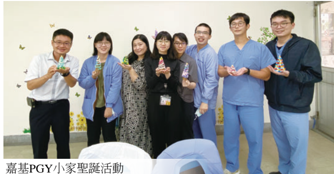
嘉基PGY小家聖誕活動