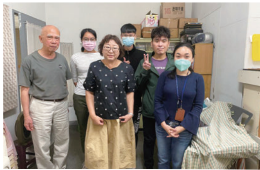
成大醫務學生團契感恩節聚會