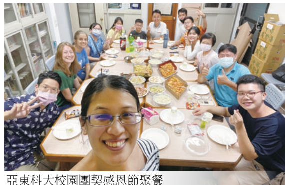
亞東科大校園團契感恩節聚餐