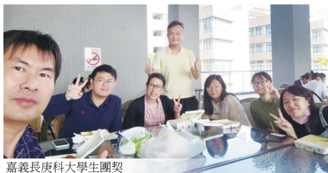
嘉義長庚科大學生團契