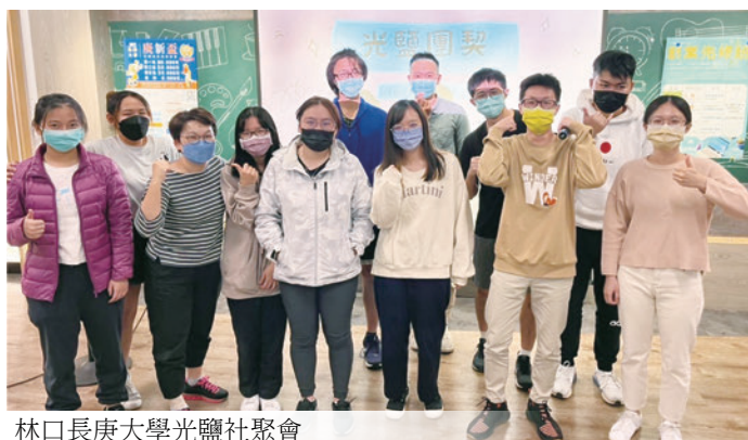
林口長庚大學光鹽社聚會