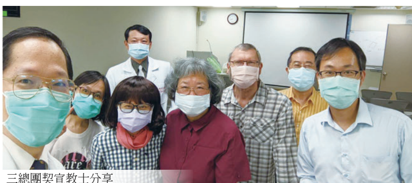
三總團契宣教士分享