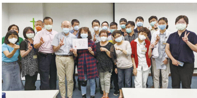
高雄長庚醫務團契