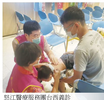
怒江醫療服務團台西義診