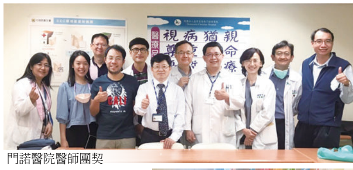
門諾醫院醫師團契