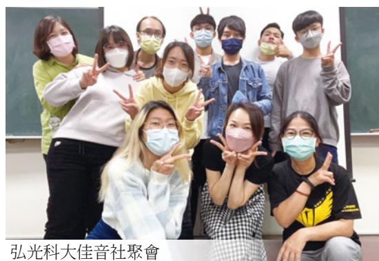
弘光科大佳音社聚會