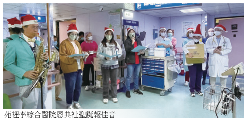
苑裡李綜合醫院恩典社聖誕報佳音