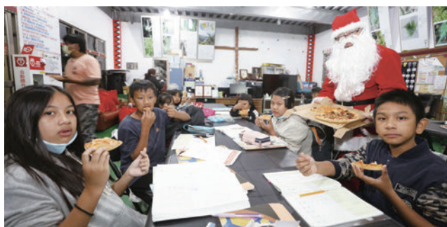
恆基與力麗觀光集團送暖偏鄉陪伴部落孩童慶聖誕