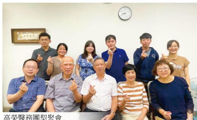
高榮醫務團契聚會