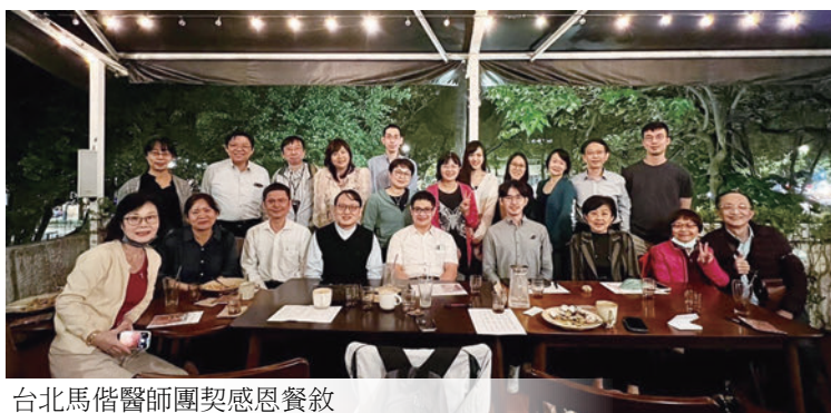
台北馬偕醫師團契感恩餐敘