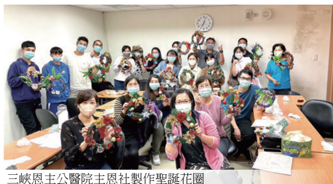
三峽恩主公醫院主恩社製作聖誕花圈