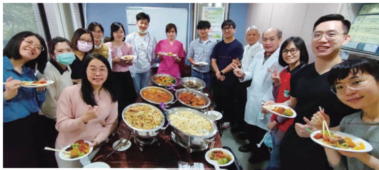
忠孝醫院牙科感恩餐會