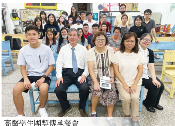
高醫學生團契傳承餐會