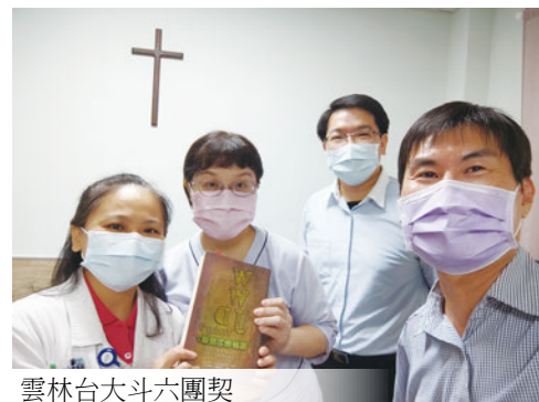
雲林台大斗六團契