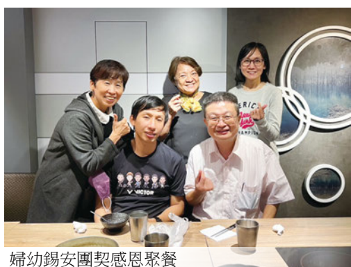
婦幼錫安團契感恩聚餐