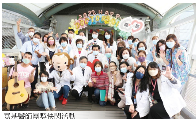
嘉基醫師團契快閃活動