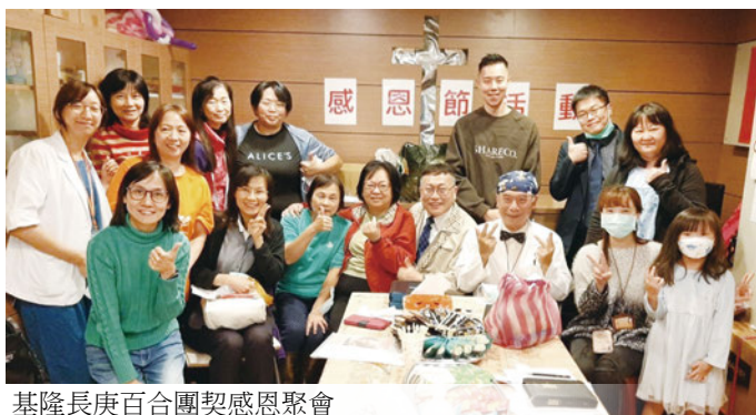
基隆長庚百合團契感恩聚會