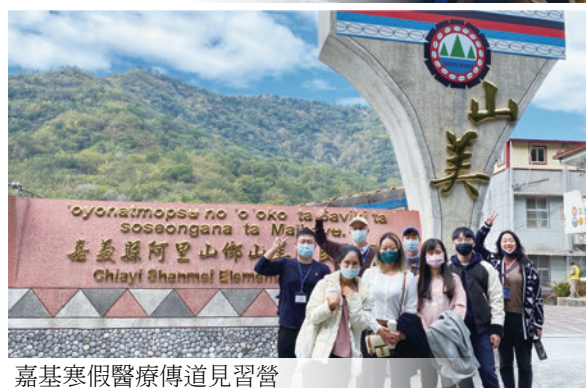
嘉基寒假醫療傳道見習營