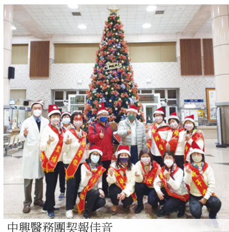
中興醫務團契報佳音