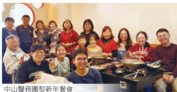
中山醫務團契新年餐會