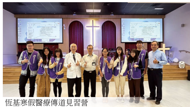
恆基寒假醫療傳道見習營