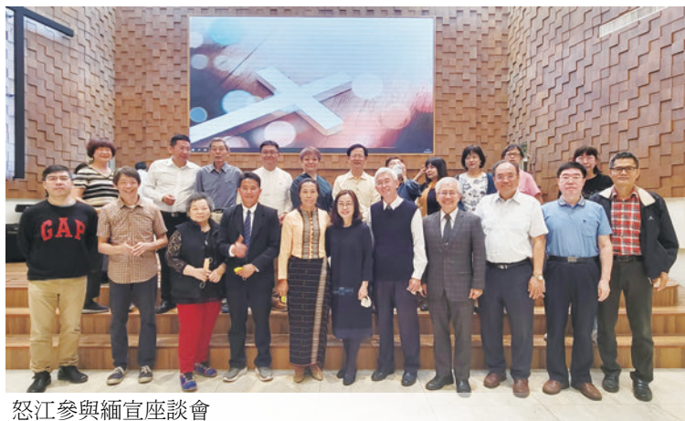
怒江參與緬宣座談會