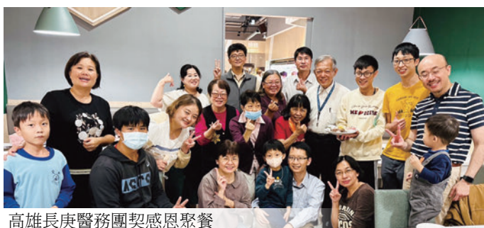
高雄長庚醫務團契感恩聚餐