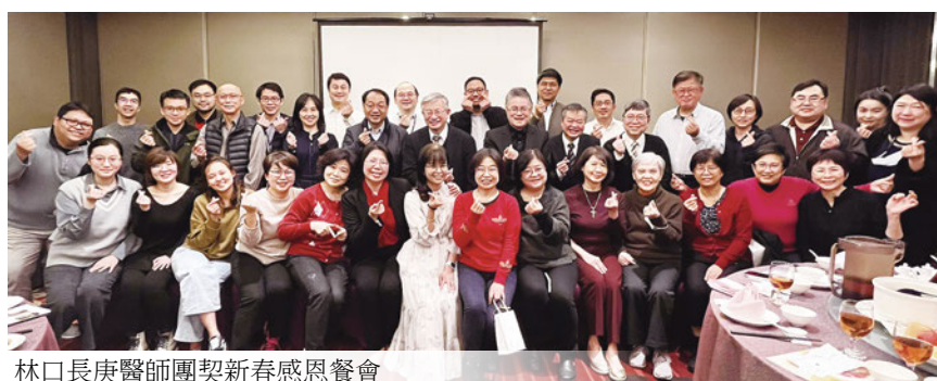
林口長庚醫師團契新春感恩餐會