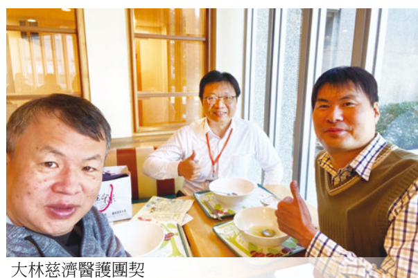
大林慈濟醫護團契