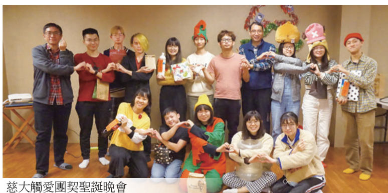
慈大觸愛團契聖誕晚會