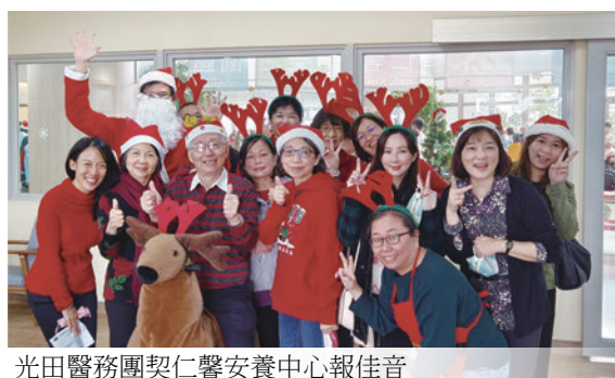
光田醫務團契仁馨安養中心報佳音