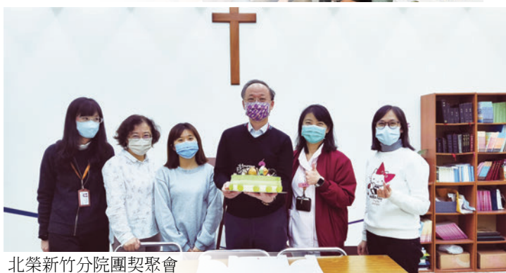
北榮新竹分院團契聚會