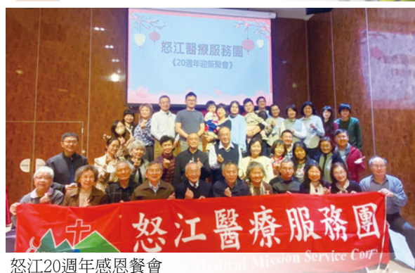
怒江20週年感恩餐會