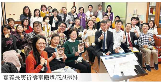
嘉義長庚祈禱室搬遷感恩禮拜