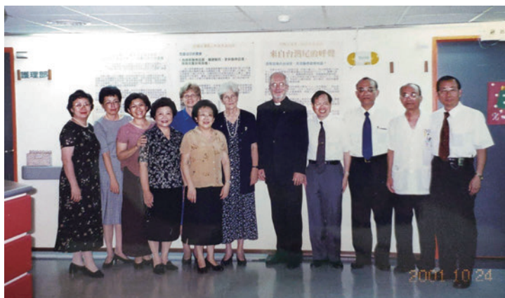
▲2001年芬蘭包樂年主席訪問恆基

此時此刻，2023年，我在這裡數算主恩，數算不完。感謝主，如路加福音17章10節：「這樣，你們做完了一切所吩咐的，只當說：我們是無用的僕人，所做的本是我們應分做的。」 CCMM