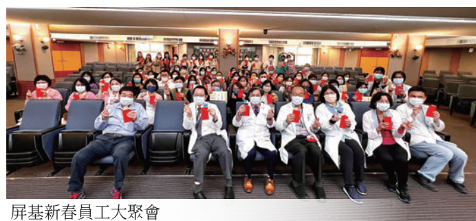
屏基新春員工大聚會