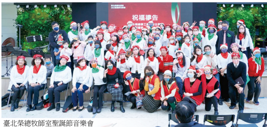
臺北榮總牧師室聖誕節音樂會