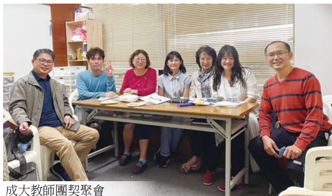
成大教師團契聚會