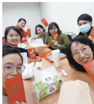
三峽恩主公醫院主恩社聚會