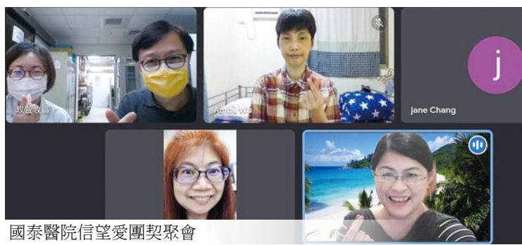
國泰醫院信望愛團契聚會