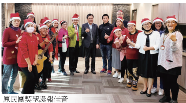
原民團契聖誕報佳音