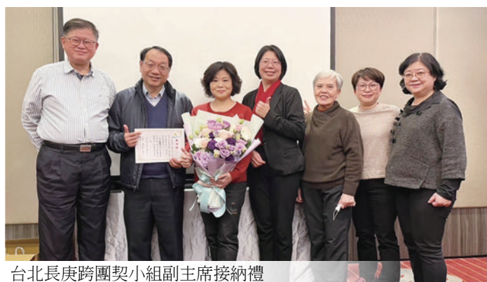
台北長庚跨團契小組副主席接納禮