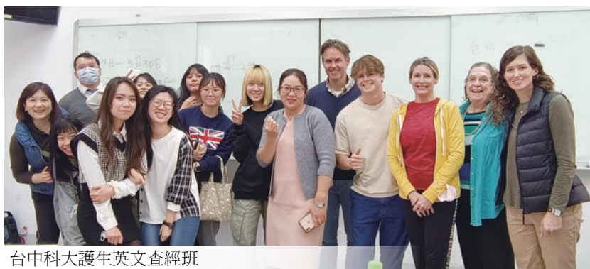
台中科大護生英文查經班