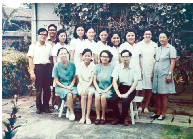
▲1973年恆基診所全體同仁