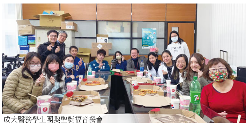
成大醫務學生團契聖誕福音餐會