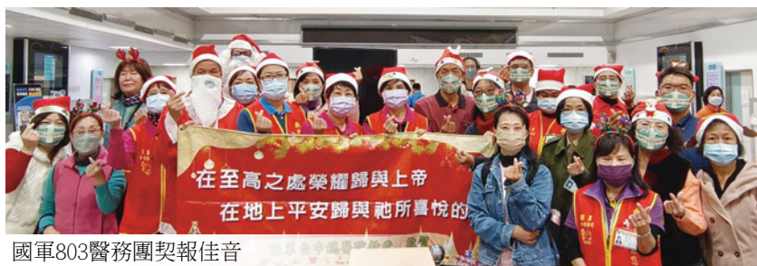
國軍803醫務團契報佳音