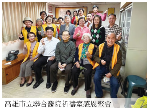
高雄市立聯合醫院祈禱室感恩聚會