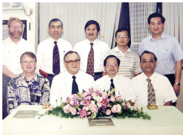
▲1997年挪威協力會同工與路加同工合影