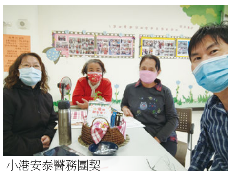
小港安泰醫務團契