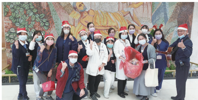
慈濟醫院恩多社聖誕報佳音