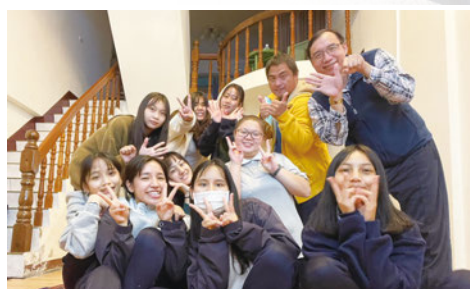
慈科大磐石團契聖誕下午茶聚會