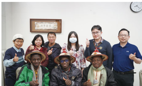
高榮團契邀請布吉納法索王貞乃宣教士分享