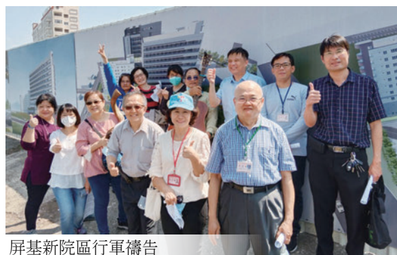
屏基新院區行軍禱告