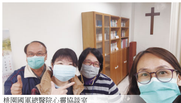
桃園國軍總醫院心靈協談室