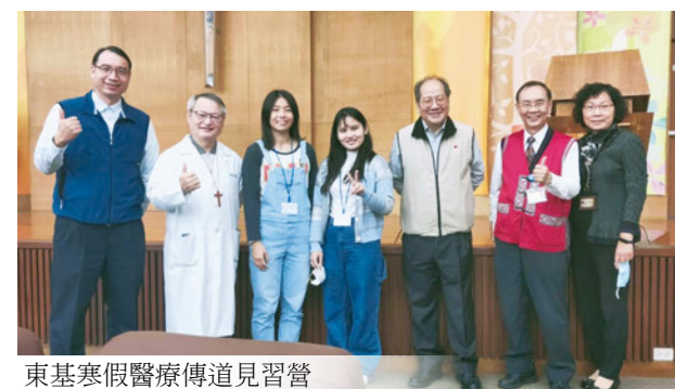
東基寒假醫療傳道見習營