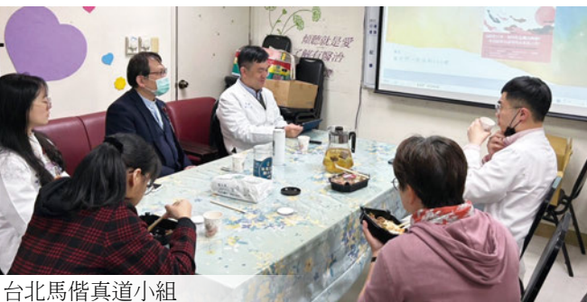
台北馬偕真道小組