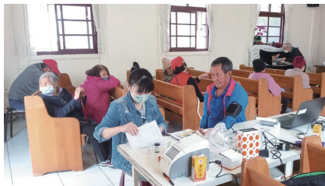
▲ 看診前先測量血壓血糖