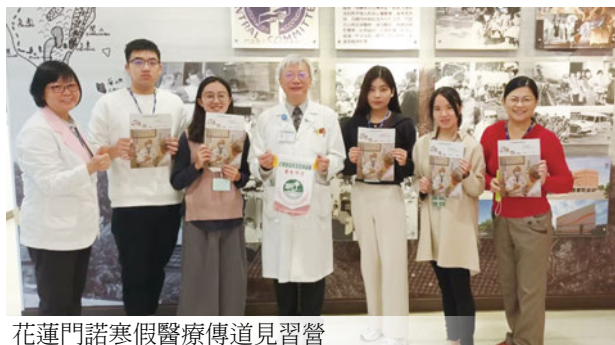
花蓮門諾寒假醫療傳道見習營