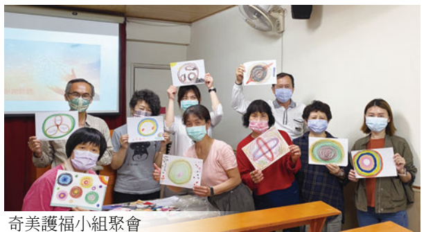
奇美護福小組聚會