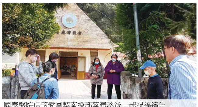
國泰醫院信望愛團契南投部落義診後一起祝福禱告