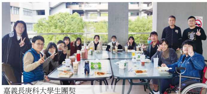
嘉義長庚科大學生團契