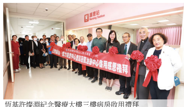
恆基許燦淵紀念醫療大樓三樓病房啟用禮拜