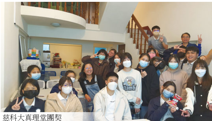
慈科大真理堂團契