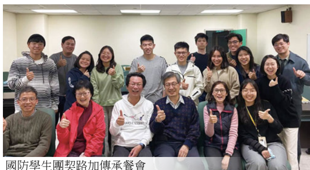
國防學生團契路加傳承餐會