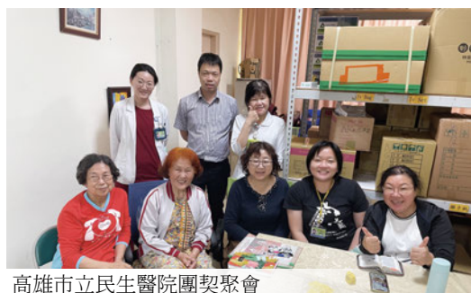
高雄市立民生醫院團契聚會