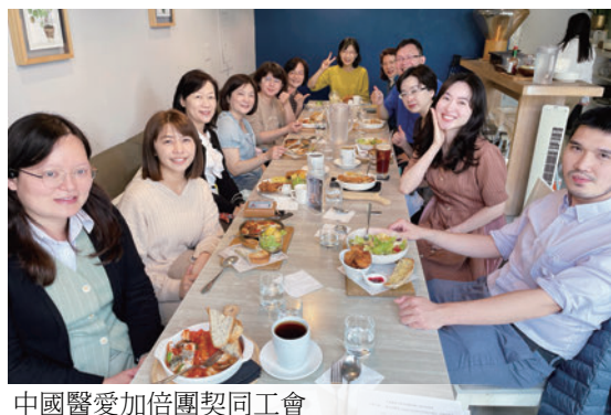
中國醫愛加倍團契同工會