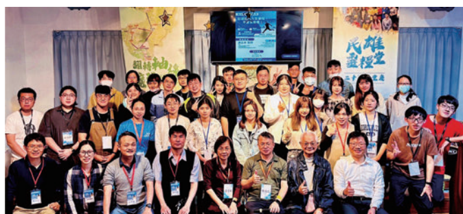
嘉義長庚科大與中正大學學生小組舉辦路加傳承餐會