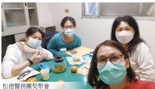
松德醫務團契聚會