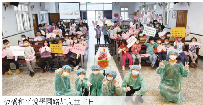
板橋和平悅學園路加兒童主日