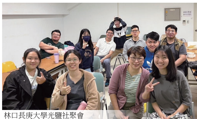
林口長庚大學光鹽社聚會