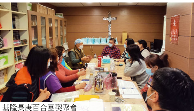
基隆長庚百合團契聚會