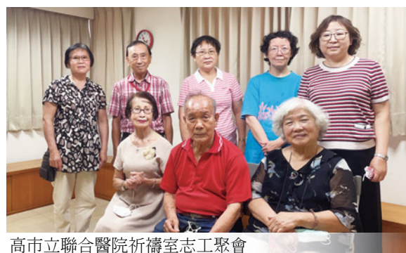
高市立聯合醫院祈禱室志工聚會