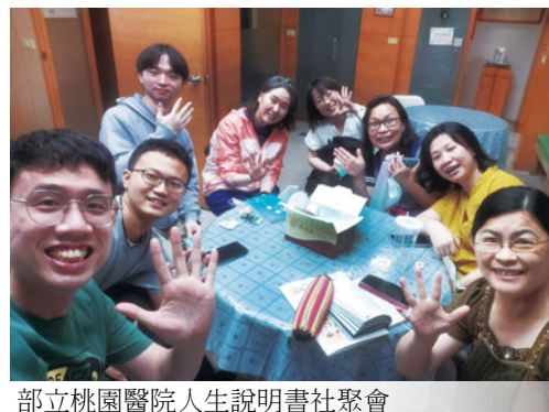
部立桃園醫院人生說明書社聚會