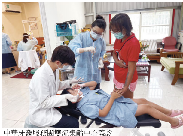
中華牙醫服務團雙流樂齡中心義診