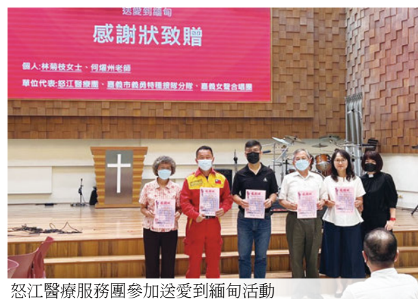
怒江醫療服務團參加送愛到緬甸活動