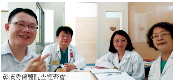
彰濱秀傳醫院查經聚會