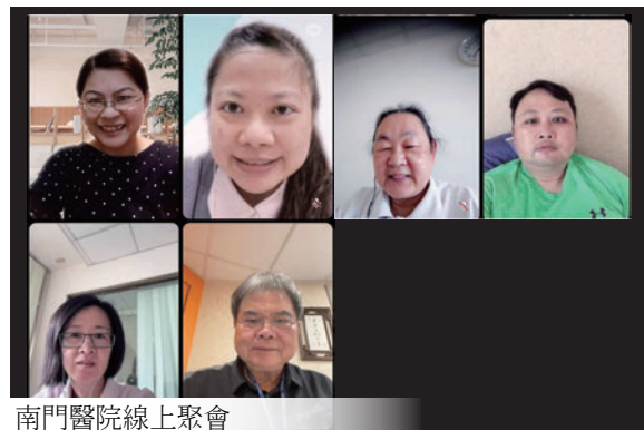
南門醫院線上聚會