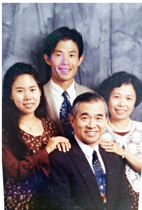
▲第二次回台前全家福

第一次返台後，原先要到陽明醫學院任教，當時因為榮總沒有主治醫師的缺，韓院長容我先回自己的母校（高醫）服務，等以