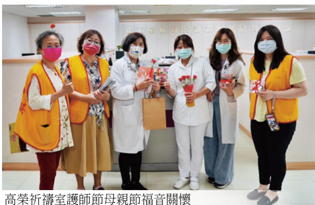
高榮祈禱室護師節母親節福音關懷