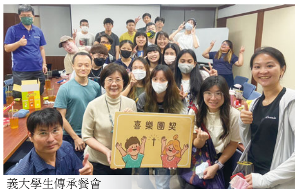
義大學生傳承餐會