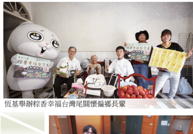
恆基舉辦粽香幸福台灣尾關懷偏鄉長輩