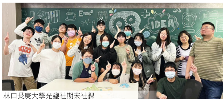
林口長庚大學光鹽社期末社課