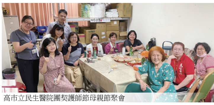
高市立民生醫院團契護師節母親節聚會