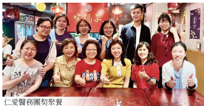
仁愛醫務團契聚餐