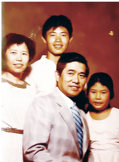
▲第一次回台前全家福

高醫畢業後，我先去服兵役而後到台北中興醫院服務。當時我心裡有想要出國深造的念頭。在父母及妻子的支持下，我飛往美國芝加哥求學，前五年在芝加哥大學（四年研究生加住院醫師訓練及一年講師）及芝加哥Loyola大學擔任助理教授三年，這一去就是八年的時間。赴美留學期間，有次我參加美國查經班舉辦的聯合退修會，被寇世遠牧師的證道深深觸動，降服在神面前認罪悔改，那時候的我才真正經歷重生。