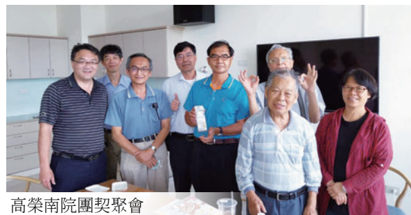
高榮南院團契聚會