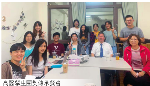
高醫學生團契傳承餐會