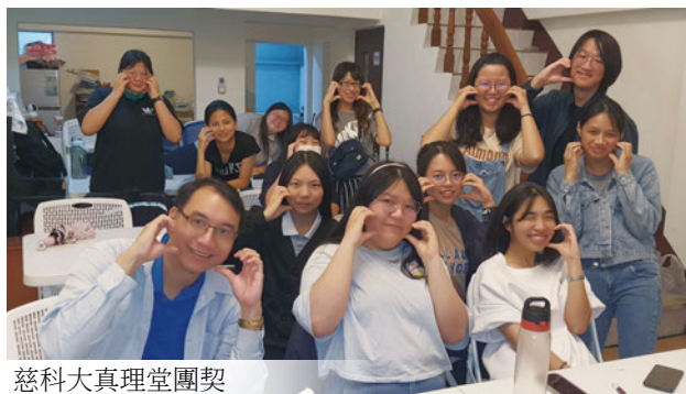
慈科大真理堂團契