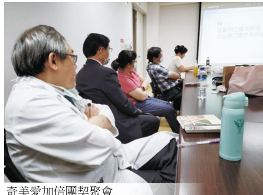
奇美愛加倍團契聚會