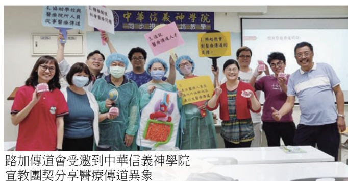
路加傳道會受邀到中華信義神學院 宣教團契分享醫療傳道典象