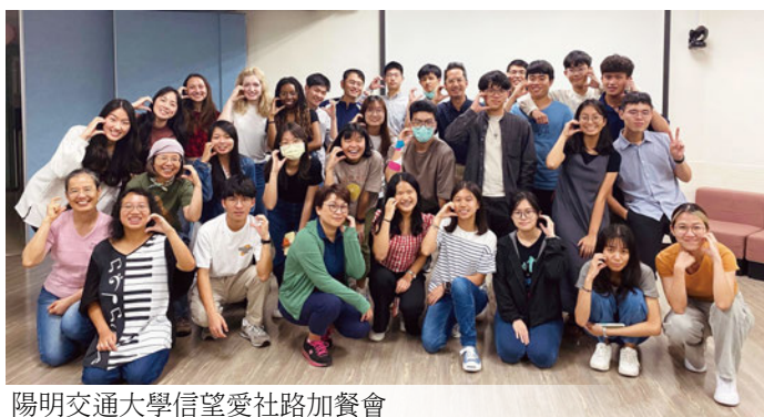
陽明交通大學信望愛社路加餐會