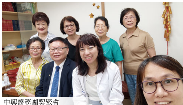
中興醫務團契聚會