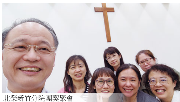
北榮新竹分院團契聚會