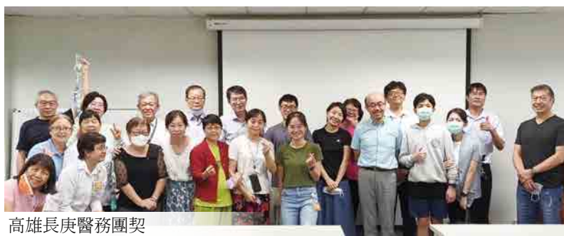
高雄長庚醫務團契