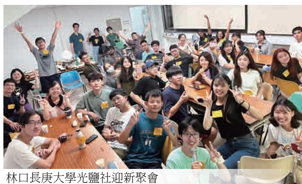
林口長庚大學光鹽社迎新聚會