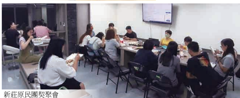
新莊原民團契聚會