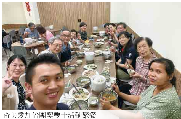
奇美愛加倍團契雙十活動聚餐