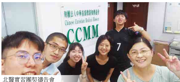
北醫實習團契禱告會