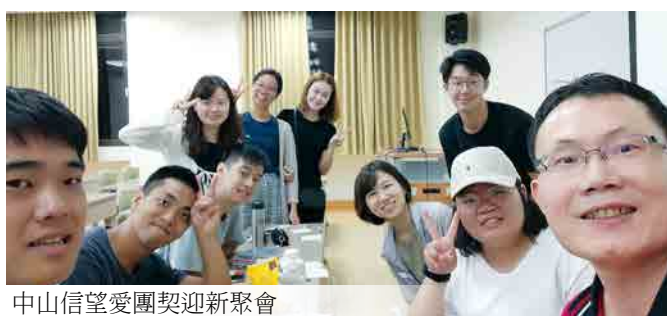
中山信望愛團契迎新聚會