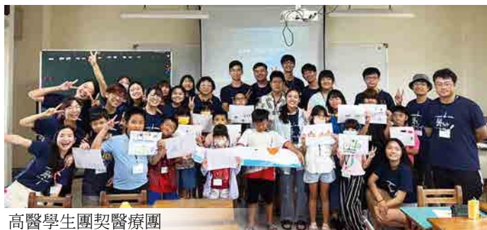
高醫學生團契醫療團