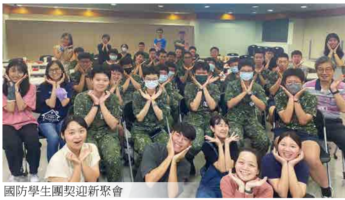
國防學生團契迎新聚會