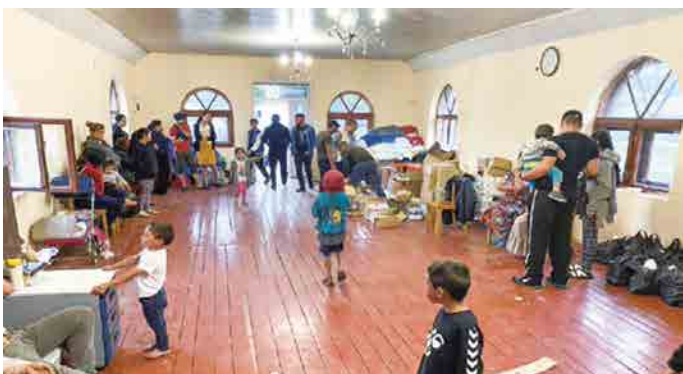
▲羅姆人睡在教會地板上，也順便聚會

2022年2月24日，從睡夢中醒來，最不願意發生的事竟然成真了。眼看家人處在危險邊緣，我又不在他們身邊，母性本能的我趕緊為他們安排撤退之路。俄軍一天就逼近