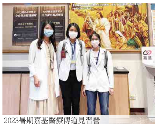
2023暑期嘉基醫療傳道見習營