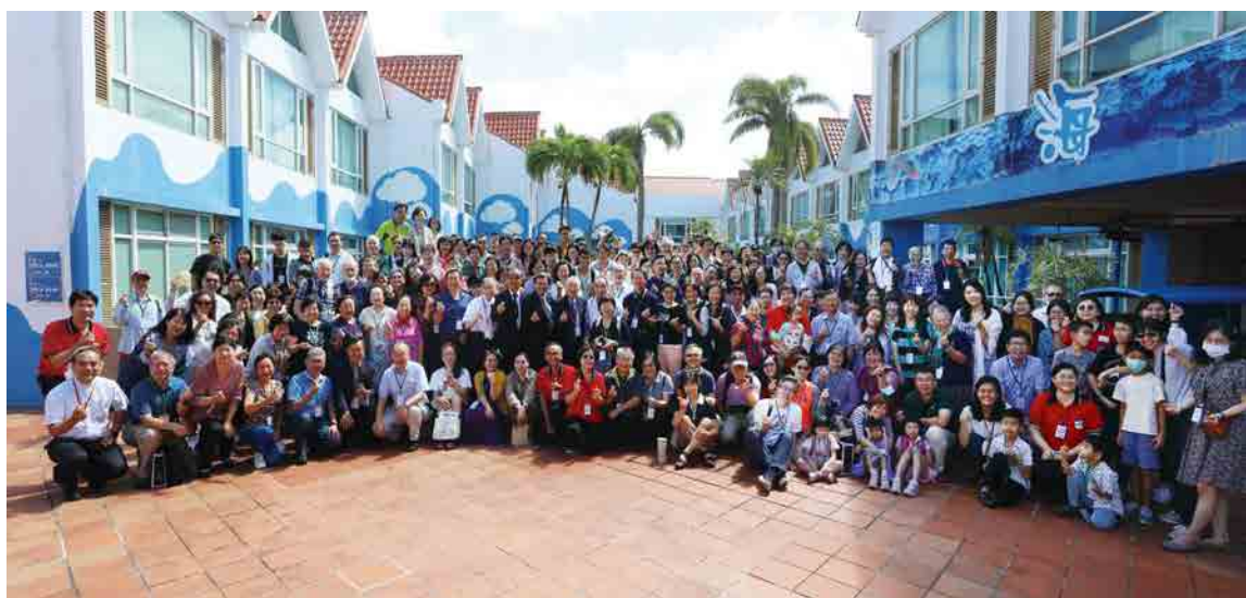
▲2023全國醫療傳道聯合退修會

徵文內容：基督徒醫療從業人員的醫療傳道生命見證，邀請您一起用文字來述說主恩、傳揚主愛。期待您的來稿～