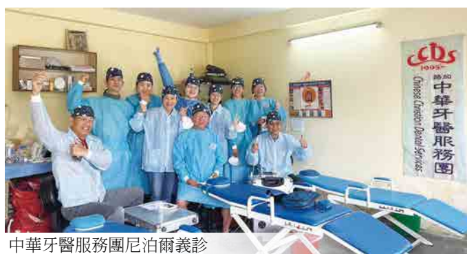
中華牙醫服務團尼泊爾義診