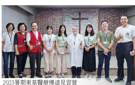
2023暑期東基醫療傳道見習營