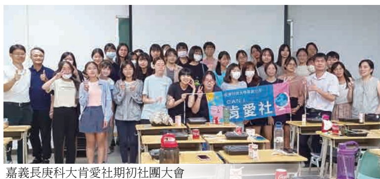
嘉義長庚科大肯愛社期初社團大會