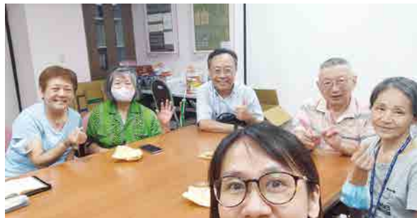
忠孝醫務團契聚會