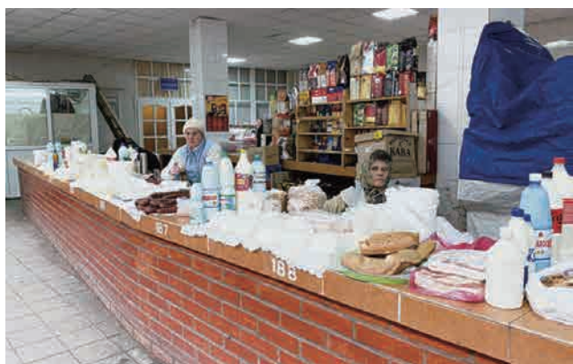
▲農家在市場販售自製的奶酪