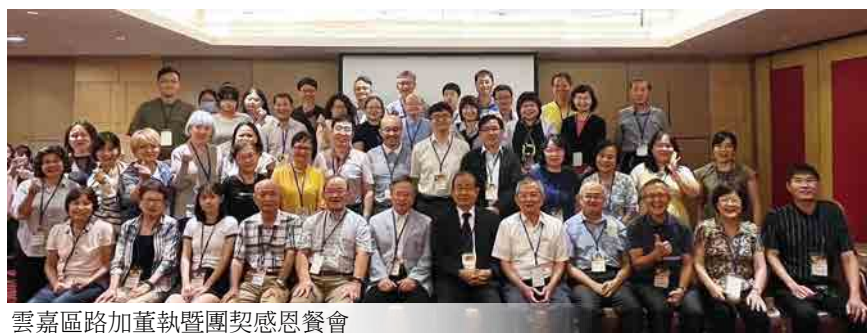
雲嘉區路加董執暨團契感恩餐會