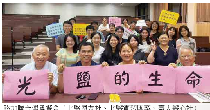
路加聯合傳承餐會 (北醫恩友社、北醫實習團契、臺大醫心社)