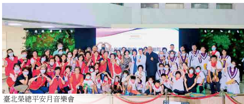
臺北榮總平安月音樂會