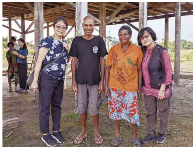
▲酋長兒子（左二）捐地建福音中心

歡送我們的那天早上，領袖們在上面唱歌時，他也頻頻落淚，我其實挺被他感動的。我覺得是神揀選並興起這個家族，讓「Yagiap」這個村莊成為基督村，是他們家族的祝福，也是對整個村子的祝福。