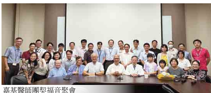
嘉基醫師團契福音聚會