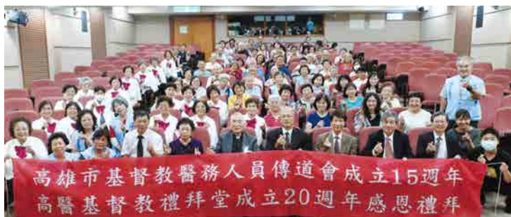
高醫祈禱室（禮拜堂）成立20週年暨傳道會成立15週年感恩禮拜