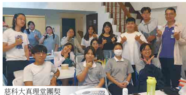
慈科大真理堂團契