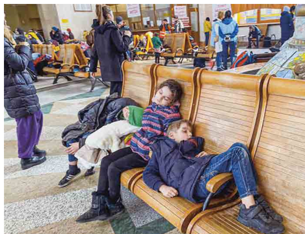
▲從戰區前來等待收容的難民