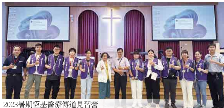
2023暑期恆基醫療傳道見習營