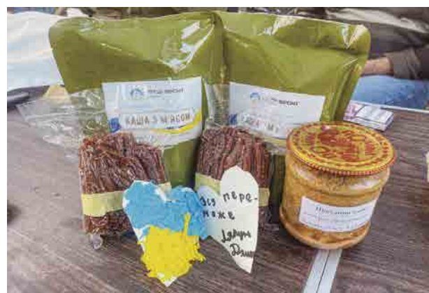
▲送到前線的肉乾和肉凍