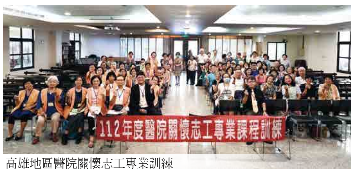
高雄地區醫院關懷志工專業訓練