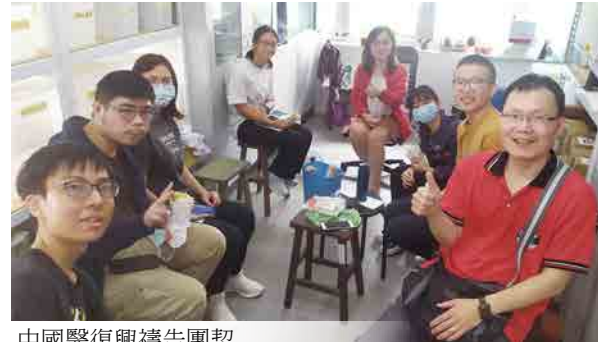
中國醫復興禱告團契