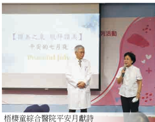
梧棲童綜合醫院平安月獻詩