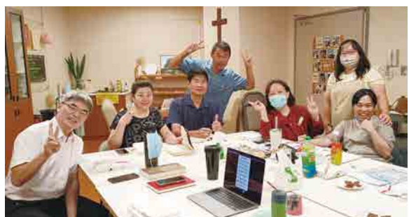
嘉義長庚醫護團契