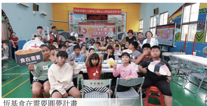
恆基食在需要圓夢計畫