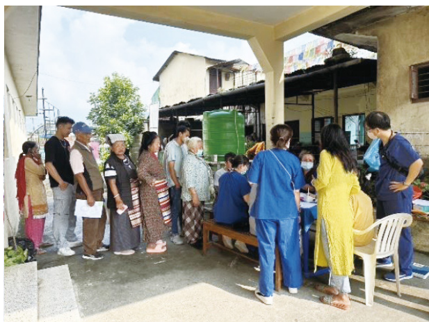
▲民眾排隊掛號看診

我也親眼看見曾在旅遊雜誌上描述過的「庫瑪麗」，被當成女神崇拜的小女孩神色嚴肅、妝容華麗地坐在滿是彩繡的椅子上，小小的腳只能踩在盛滿供奉錢財的銅盤中，硃砂在她的右手小指上，她謹慎地抹在每位跪拜的信眾額心上頭。走出那棟窄小而古老的小屋，她生活的矮樓狹窄