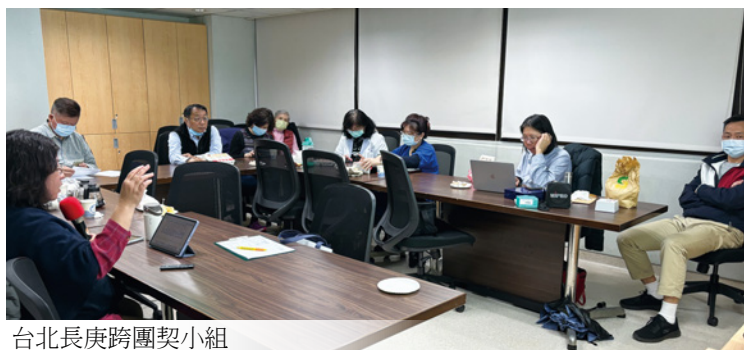
台北長庚跨團契小組