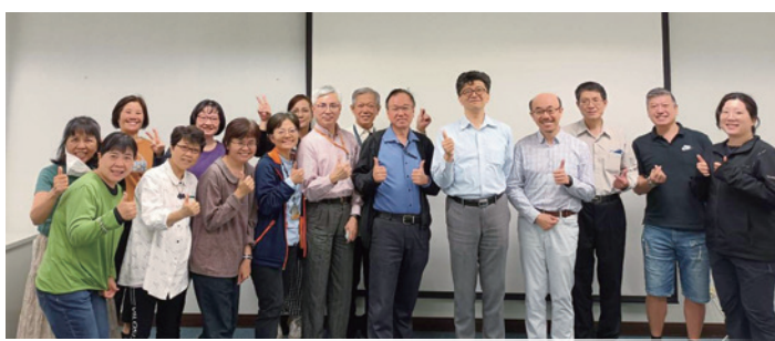
高雄長庚醫務團契