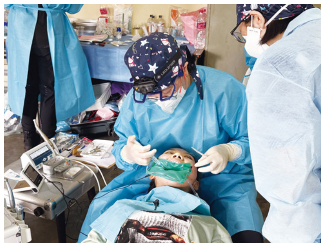
▲牙醫師為病人看診治療牙齒

海外義診和許多偏鄉醫療一樣，總會遇到很多讓我們很掙扎的狀況。簡單的，就像決定幫導遊先生留下牙齒；困難的，