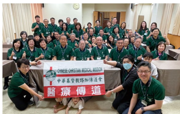
路加董執顧問暨同工退修會