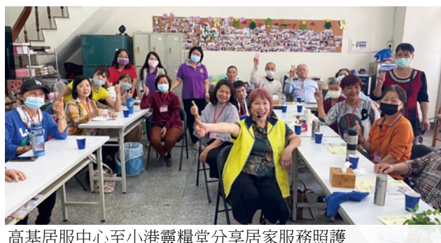
高基居服中心至小港靈糧堂分享居家服務照護