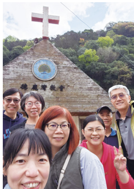
國泰醫院信望愛團契南投仁愛鄉部落義診