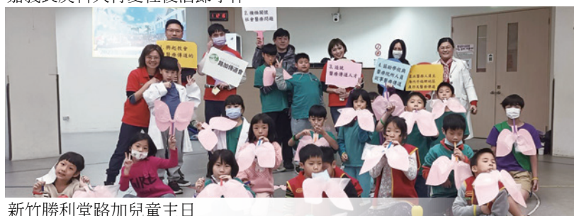
新竹勝利堂路加兒童主日