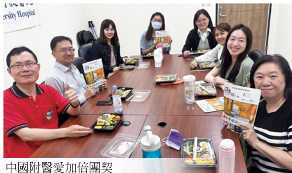
中國附醫愛加倍團契