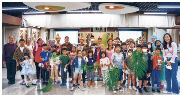
台北和平長老教會路加兒童主日