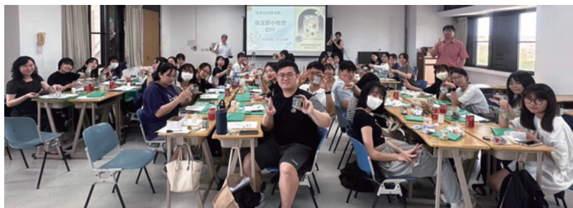
嘉義長庚科大肯愛社復活節手作