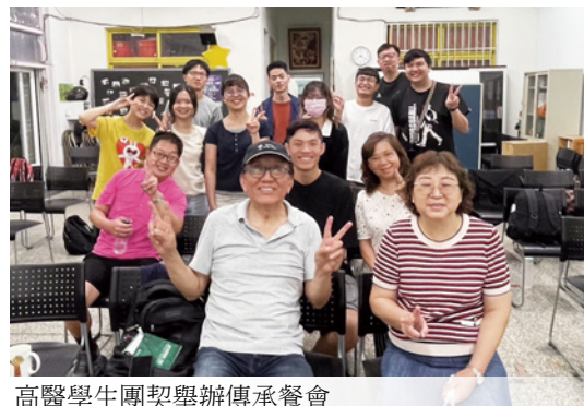
高醫學生團契舉辦傳承餐會