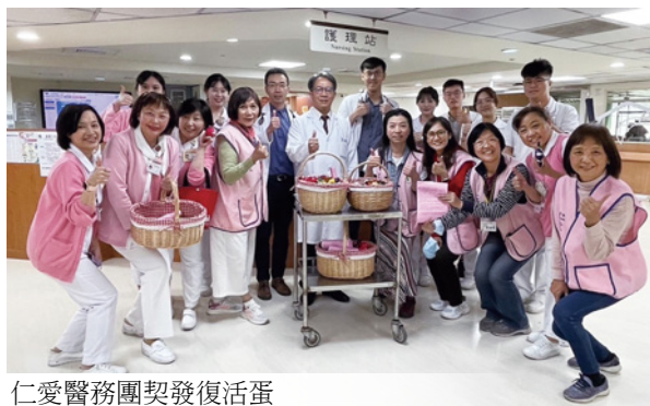
仁愛醫務團契發復活蛋