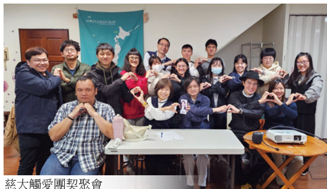
慈大觸愛團契聚會