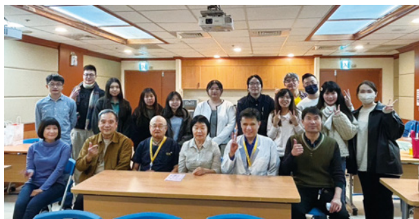
嘉義長庚科大路加傳承餐會暨屏基職宣聯誼活動