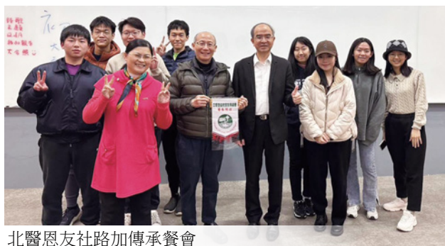
北醫恩友社路加傳承餐會