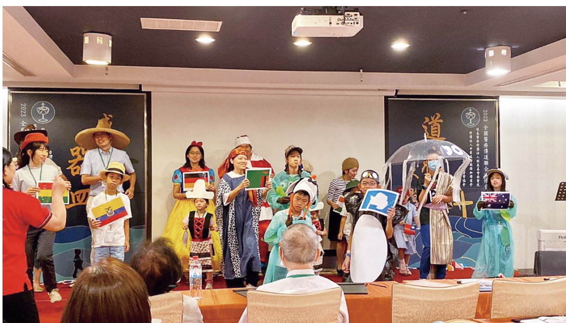
▲2023年全國醫療傳道聯合退修會親睦之夜，兒童營孩子與家長一同演出

一轉眼，三天兩夜的兒童營很快就結束了，看著微微發了芽的豆子，我並沒有很積極地叮囑孩子要記得帶回，總想著幾