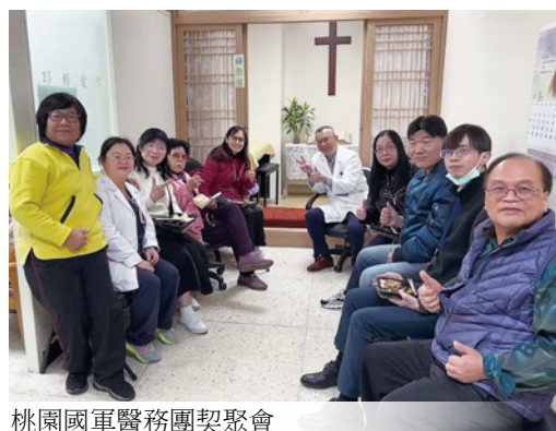
桃園國軍醫務團契聚會