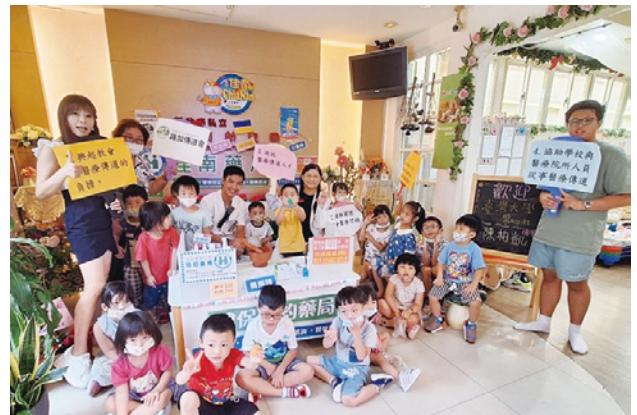
▲佳南幼兒園小醫生&小護士醫療營

在這次小小醫療營的服事中，我也出現了這樣的狀態，發現自己想要建立一個很厲害的形象，在講稿中塞入了許多複雜