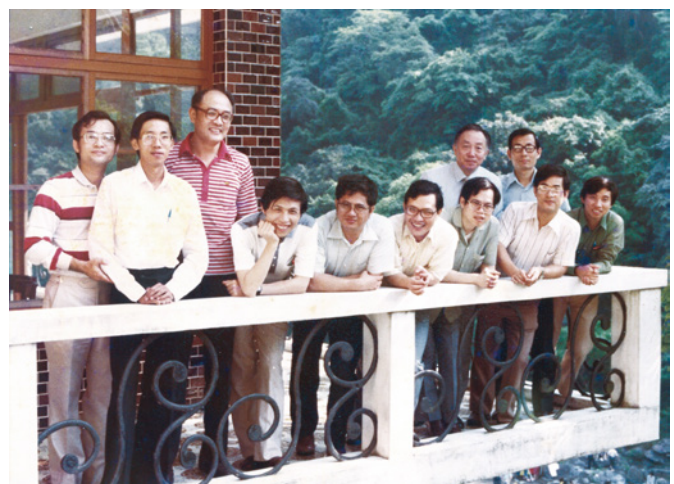
▲1977台灣中華醫藥傳道會CCMM一起編織醫療傳道美夢的夥伴

自從有歷史以來，宣道策略本來就沒有固定。歷代宣道的策略，包括：（一）名嘴宣講：藉著基督徒的領袖魅力來宣講福音與真理。（二）家庭探訪：透過家戶探訪佈道來傳揚福音。（三）擒賊擒王：從上而下的宣道策略，當國家領袖歸信基督，帶領國家成為基督教國家，進而影響百姓。（四）街頭呼喊：透過福音車或舉看板，宣揚福音喚醒人悔改。（五）小組外展：透過「啓發課程」（The Alpha Course）在小組中建立友誼關係，進一步傳揚福音。（六）醫療傳道：海內外醫療義診團至偏遠地區進行醫療服務，進一步傳福音給當地病患及百姓。（七）媒體聯網：人工智慧（AI）和虛擬實境（VR）是未來世界的趨勢，因應時代變化，運用未來科技來宣揚福音。（八）友誼分享：透過建立關係、陪伴交誼，傳福音領人信主；不只是陪對方走一里路（帶領對方決志、受洗），而是要陪對方走二里路（使對方從信徒到門徒），信主得救之後，願意繼續傳福音領人歸主。