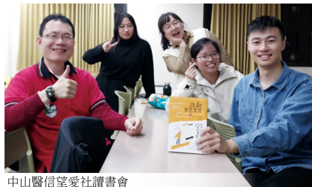
中山醫信望愛社讀書會