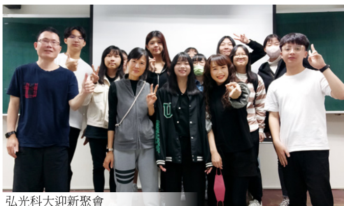
弘光科大迎新聚會