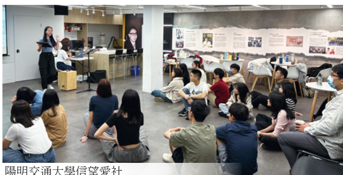
陽明交通大學信望愛社