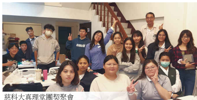
慈科大真理堂團契聚會