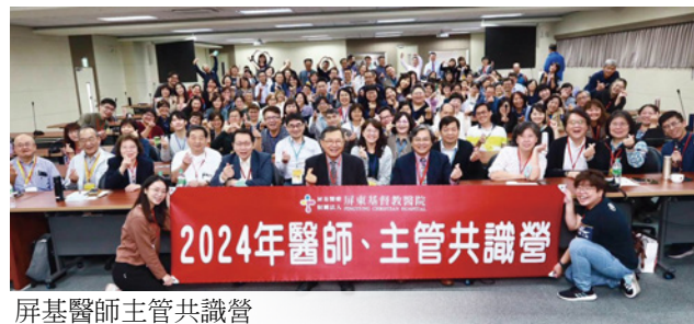
屏基醫師主管共識營