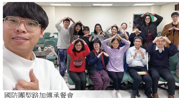
國防團契路加傳承餐會