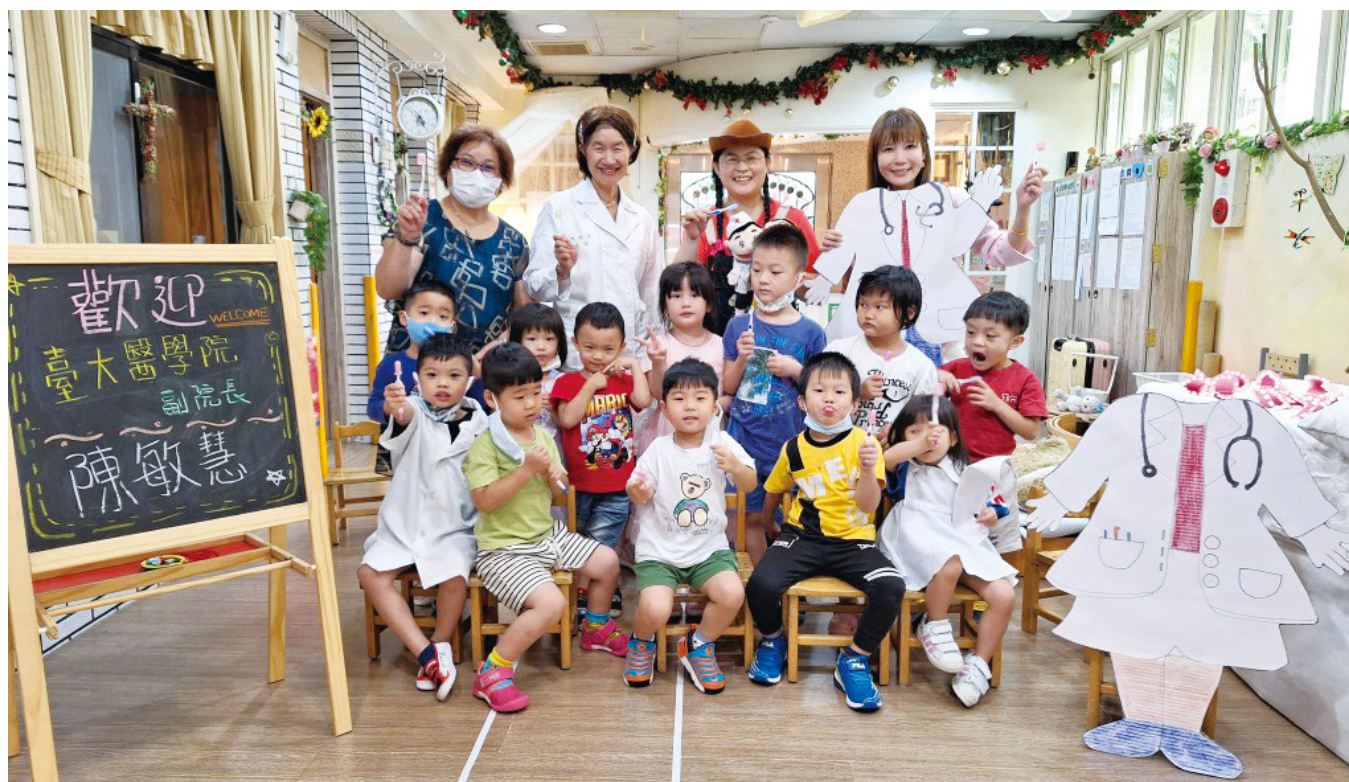
▲佳南幼兒園小小醫療營