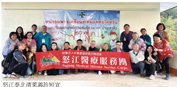
怒江泰北清萊義診短宣