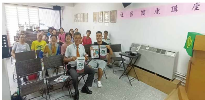
▲路加傳道會與信義會台北和平教會合辦社區健康講座

過去以工作為生活的重心，也承載著人生的價值與意義；當從職場退下來後，生活重心隨之轉移，人生價值與意義需要重新找尋，有些人甚至在找尋過程中，不小心陷入迷惘與憂鬱之中。