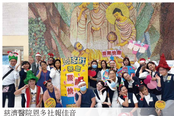
慈濟醫院恩多社報佳音