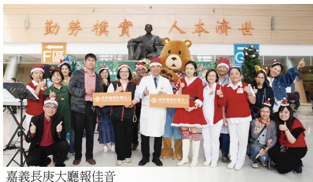
嘉義長庚大廳報佳音