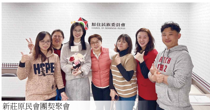
新莊原民會團契聚會