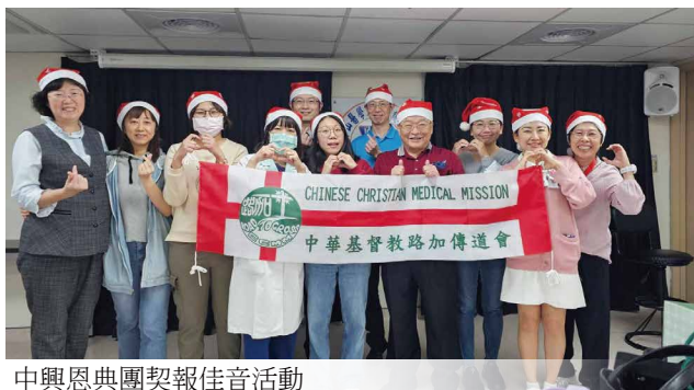
中興恩典團契報佳音活動