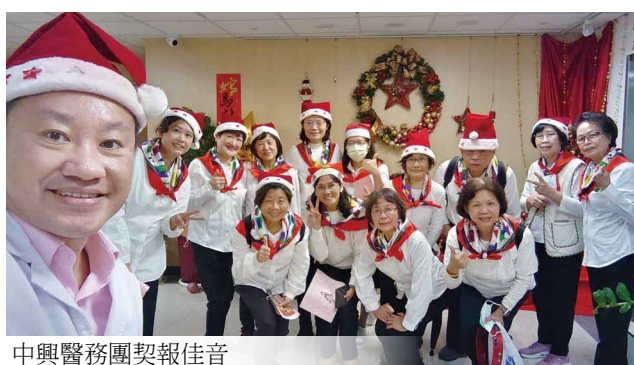
中興醫務團契報佳音