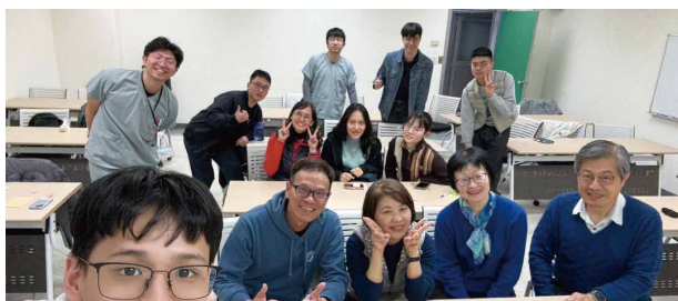
國防學生團契聚會