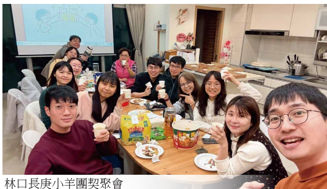
林口長庚小羊團契聚會