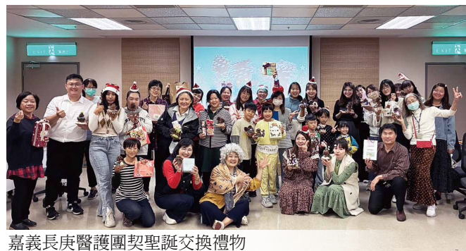
嘉義長庚醫護團契聖誕交換禮物