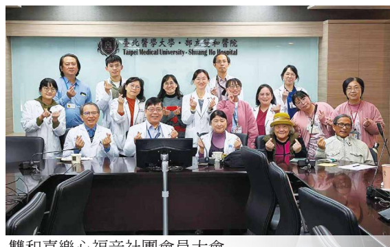
雙和喜樂心福音社團會員大會