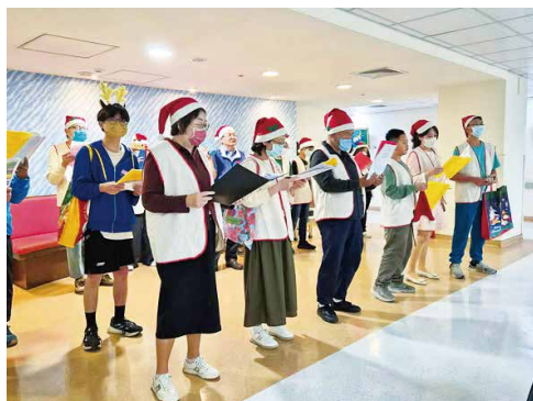
國軍高雄總醫院福音室聖誕報佳音