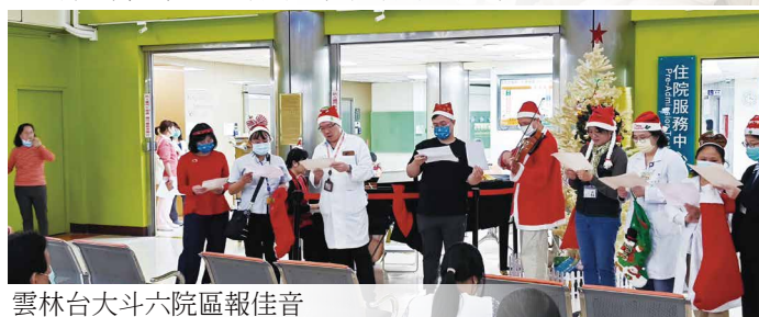
雲林台大六院區報佳音