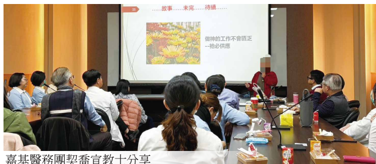
嘉基醫務團契喬宣教士分享