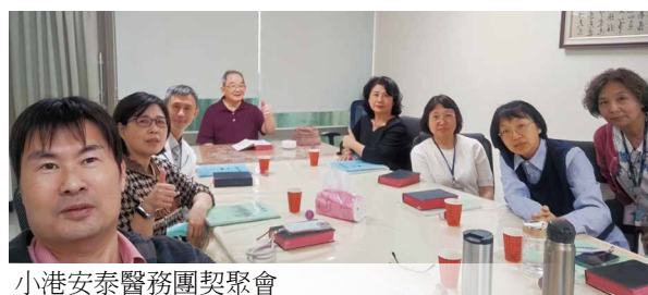
小港安泰醫務團契聚會