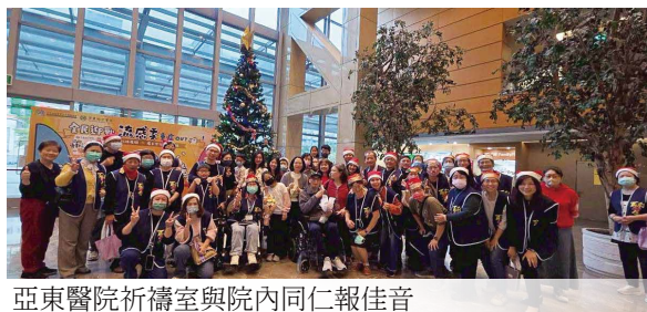
亞東醫院祈禱室與院內同仁報佳音