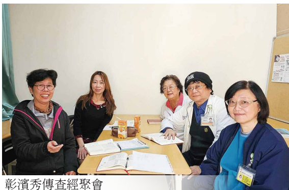
彰濱秀傳查經聚會