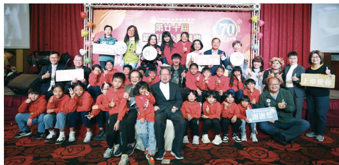
恆基第20屆銀髮童心圍爐