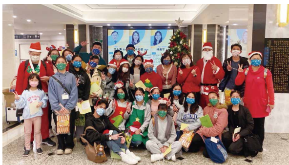
三峽恩主公醫院全院報佳音