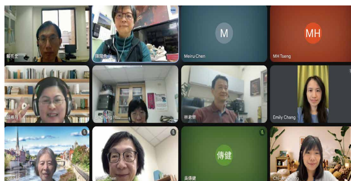
台大教職員線上查經聚會