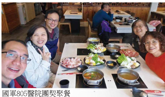
國軍805醫院團契聚餐