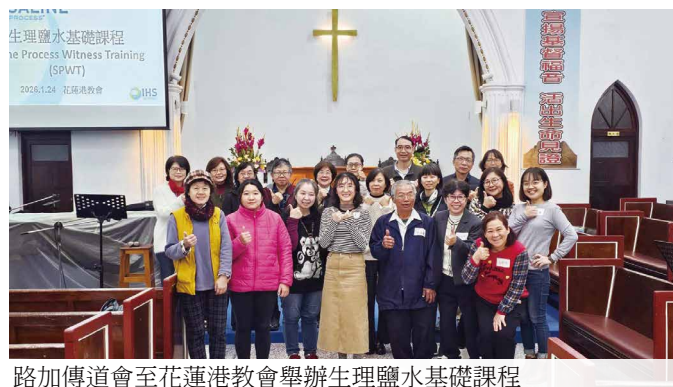
路加傳道會至花蓮港教會舉辦生理鹽水基礎課程