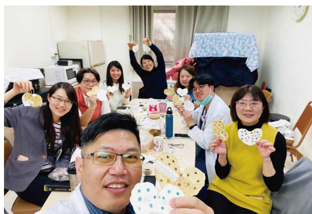
淡水馬偕真道小組聚會