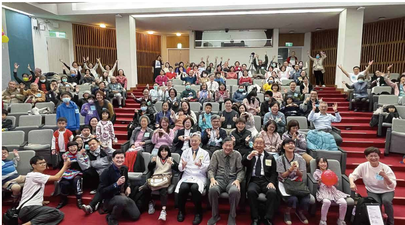
▲中榮聖誕講座大合影

從創世記到啓示錄見證了耶穌的生命不斷被複製與傳承。我們是按神的形像所造，但神比我們更完全，因為祂「道成了肉身，住在我們中間，充充滿滿地有恩典有真理。我們也見過祂的榮光，正是父獨生子的榮光。」（約翰福音1章14節）研究基因使我更加敬畏上帝，並從每個受造之物看見造物主的存在。正如，約伯所說：「我從前風聞有你，現在親眼看見你！」（約伯記42章5節）