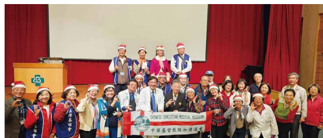
彰濱秀傳聖誕講座及報佳音活動