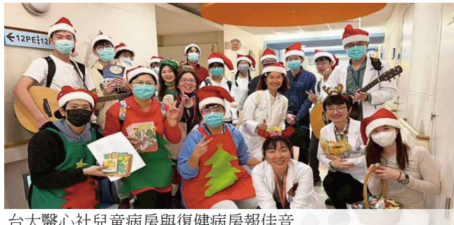
台大醫心社兒童病房與復健病房報佳音