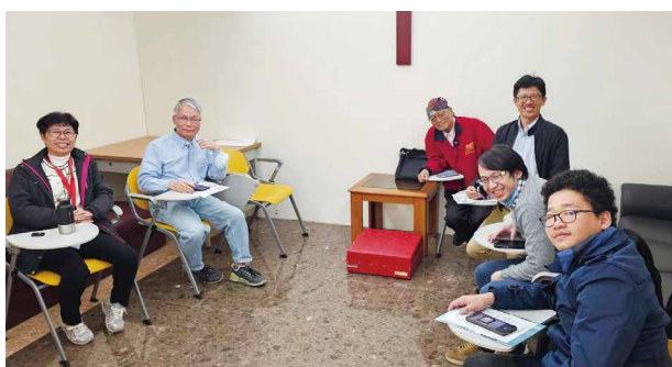
彰化醫院光鹽社查經聚會