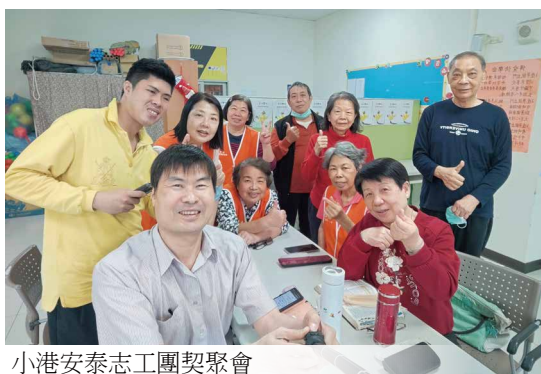
小港安泰志工團契聚會