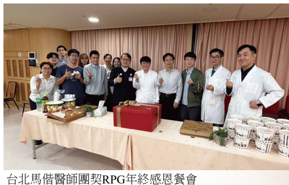
台北馬偕醫師團契RPG年終感恩餐會