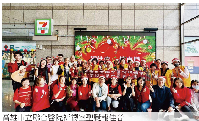
高雄市立聯合醫院祈禱室聖誕報佳音